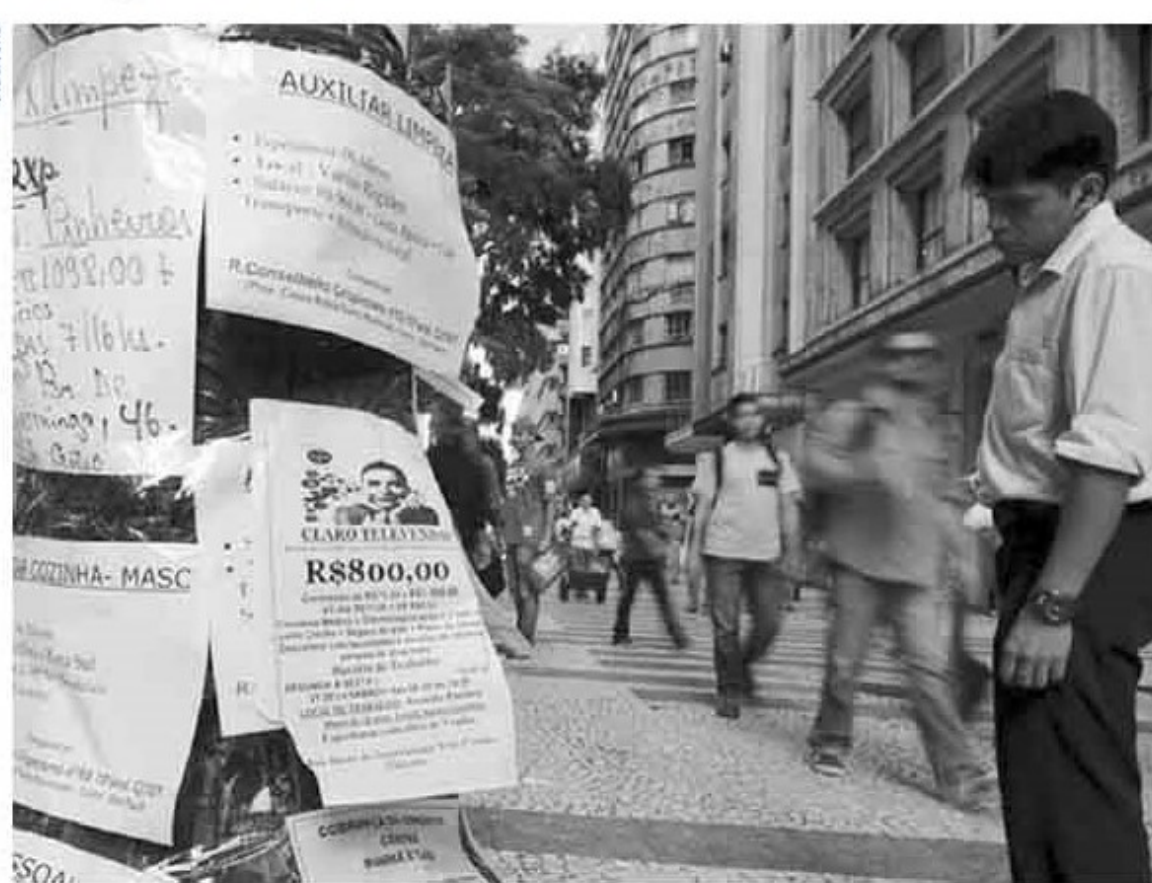
Homem observa anúncios de vagas de trabalho no centro de São Paulo.

O país tinha, de novembro de 2015 a janeiro de 2016, 91,7 milhões de pessoas empregadas, 656 mil menos que no trimestre de agosto a outubro de 2015. Em comparação com igual trimestre de 2015, foi registrada queda de 1,1%, na população ocupada (1 milhão de pessoas a menos). Entre o trimestre encerrado em outubro do ano passado e de janeiro deste ano, o número de empregados com